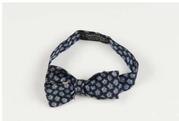
Рис. 7. Галстук-бабочка (Париж, 1920-е гг.)