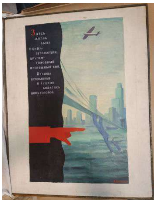
Рис. 3. В. Роскин Бруклинский мост. Иллюстрация к стихам Маяковского В.В. об Америке (1941)