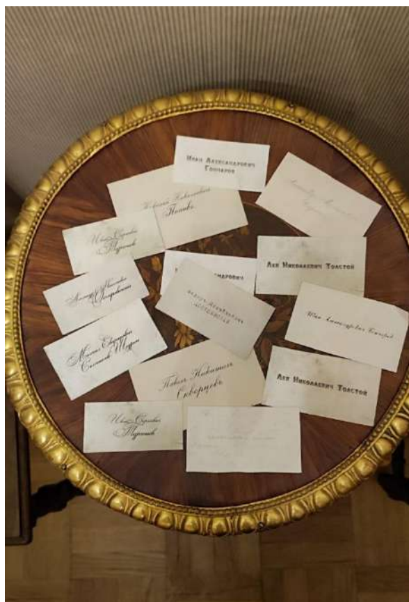
Рис. 1 Столик для визиток при входе в квартиру Н.А. Некрасова