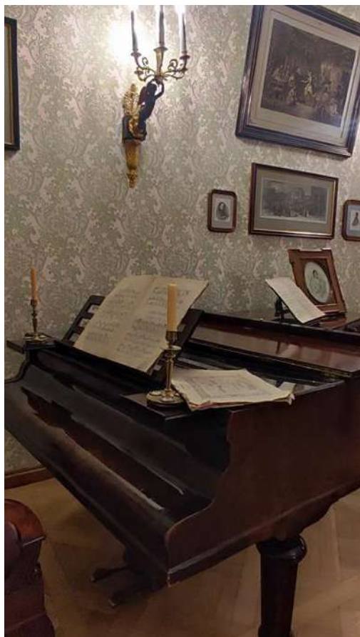
Рис. 3 Рояль в комнате А.Я. Панаевой