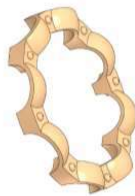
Рис.3 – Образец 3D-модели одной части сепаратора

Шариковый подшипник – тип подшипника качения, в котором в качестве тел качения используются шарики. Подшипники служат опорами для вращающихся валов различных механизмов и машин, снижающими трение.