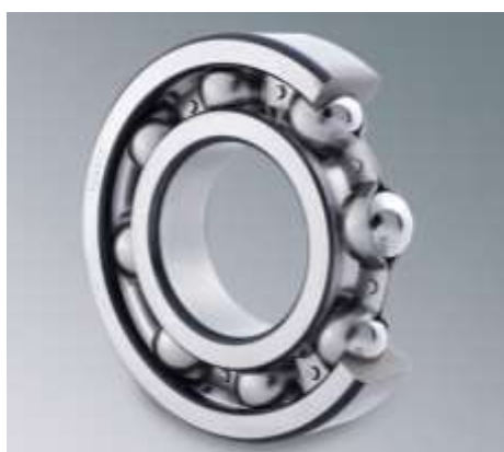
Рис.1 – Шариковый подшипник (с частичным вырезом наружного кольца для демонстрации)

Изделие: Модель радиального шарикового подшипника.