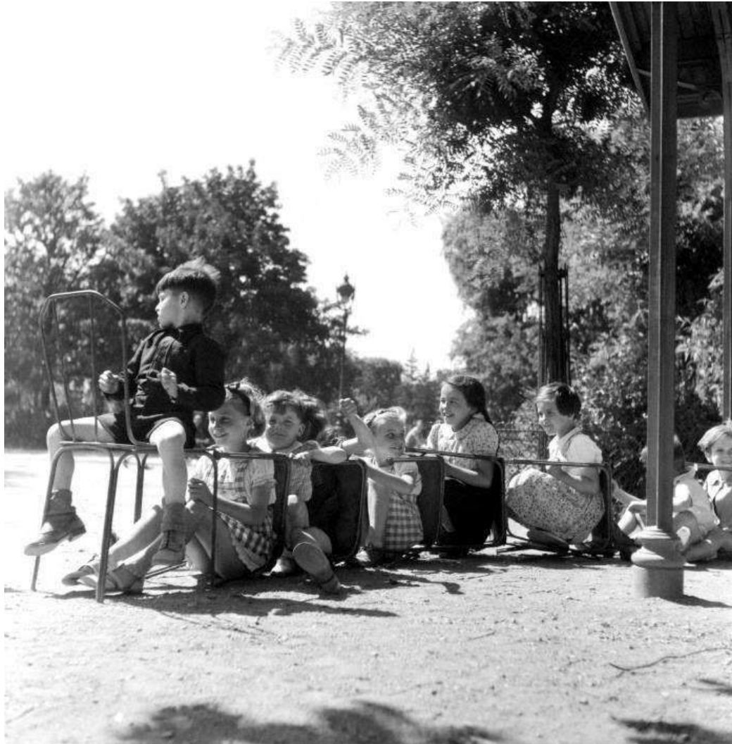
Photographie de Robert Doisneau

Thème : Devenu adulte, un des enfants de la photographie raconte les jeux de son enfance. Il évoque la scène représentée sur la photographie. Vous imaginerez son récit en montrant comment le jeu permet aux enfants dans un moment de joie partagée de transformer la réalité qui les entoure.