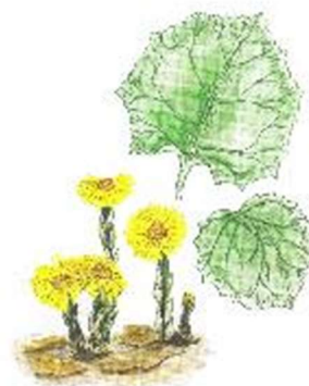
в) Мать-и-мачеха обыкновенная