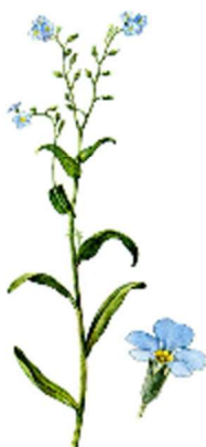
г) Незабудка болотная