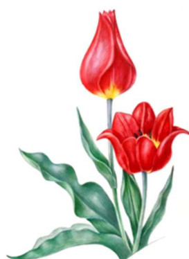
д) Тюльпан Шренка