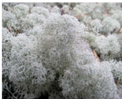
б) лишайник ягель (виды родов кладина и кладония)