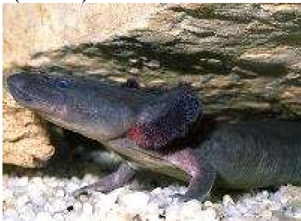
А) протей американский