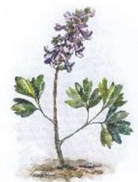
е) Хохлатка плотная