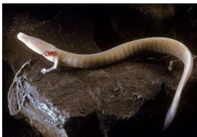
Б) протей европейский

Внимательно прочитайте описание характеристик животных – представителей класса земноводных, всю жизнь обитающих в воде; вспомните отличительные особенности строения животных этого класса на этапе водного образа жизни и установите соответствие между изображёнными на фотографиях животными (А) и (Б) и приведёнными признаками.