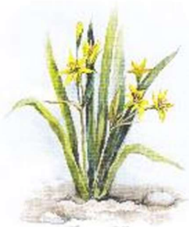
б) Гусиный лук, или Гейджия