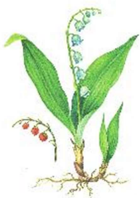
а) Ландыш майский

Весеннецветущие растения, или первоцветы – это многолетние травянистые растения с непродолжительным периодом цветения. Выберите первоцвет, у которого в распространении семян участвуют муравьи. Данный вид занесён в Красную книгу города Москвы.