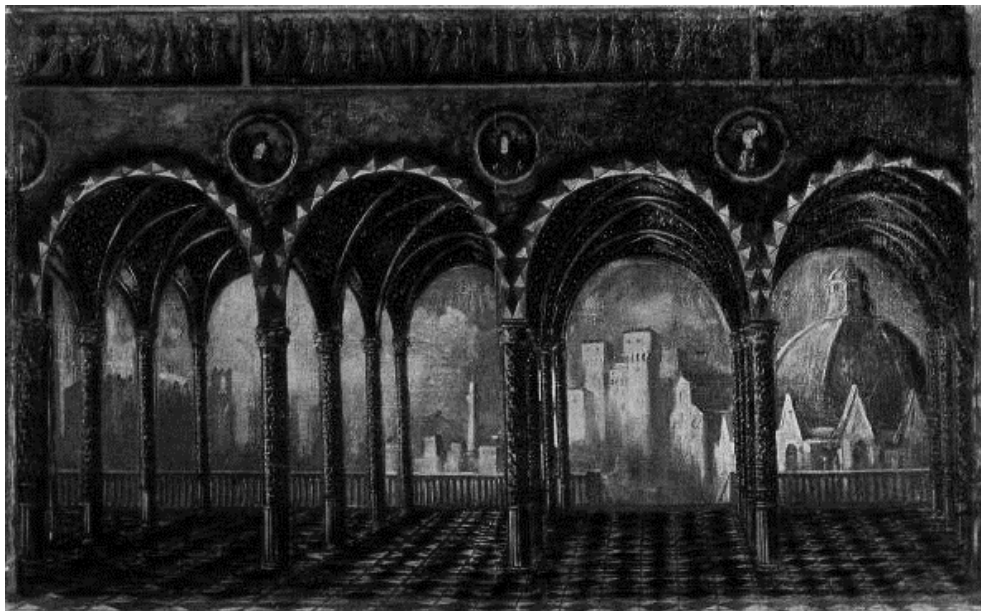
Эскизы П. Вильямса к балету «Ромео и Джульетта» (1946)

А. В задании представлены два эскиза декораций Петра Вильямса к балету «Ромео и Джульетта» и несколько итальянских скульптурных и архитектурных сооружений, на которые он опирался в своих работах.